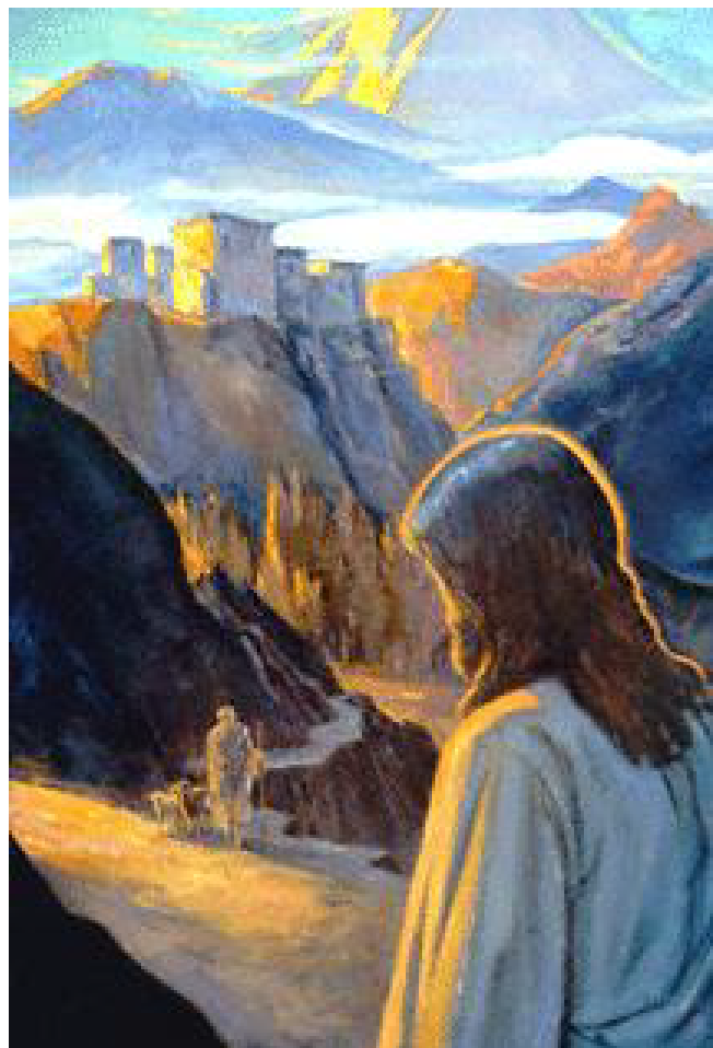
Oil painting by J. Michael Spooner

(Jesus im Oktober 38, wiedergegeben in 'Galiläa Zeitenwende' von Uwe Sananda, Die Biographie Jesu, NEXT-BOOKS.de, März 2008, S 181)