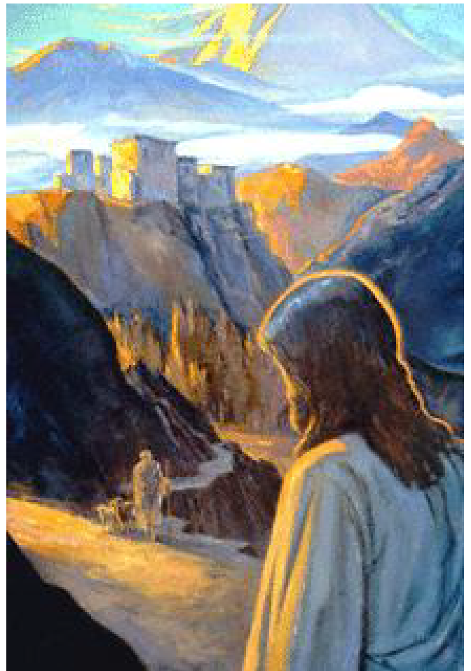
Oil painting by J. Michael Spooner

http://www-user.uni-bremen.de/~wie/Secret/secmark_einleit.html